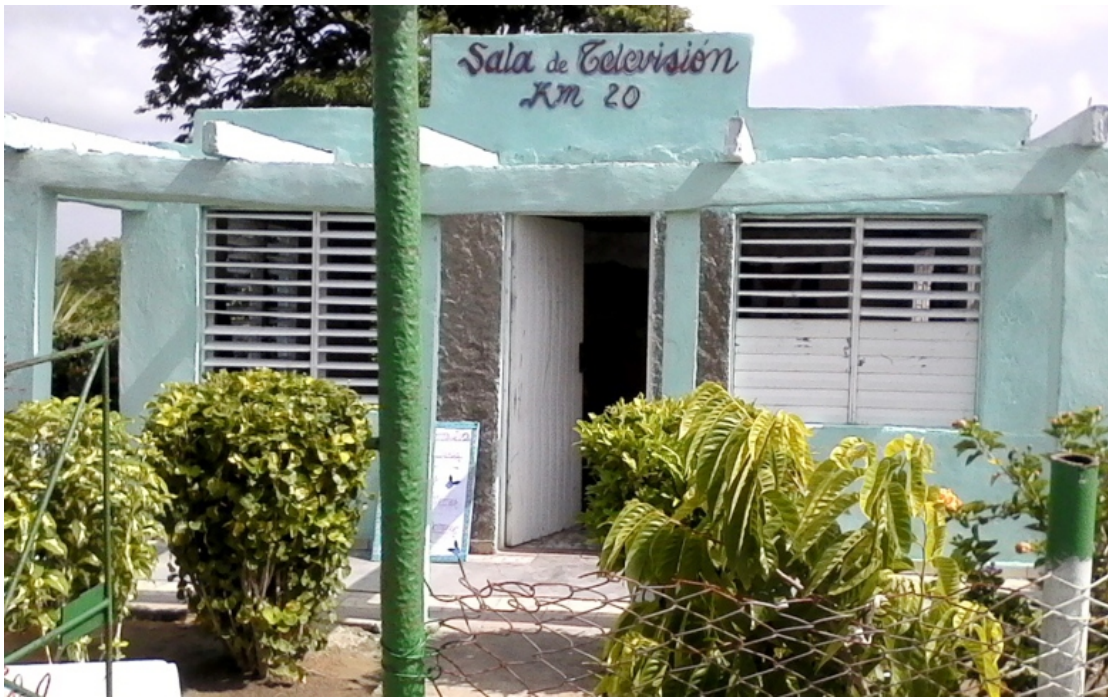
SALAS DE TELEVISIÓN Y VIDEO