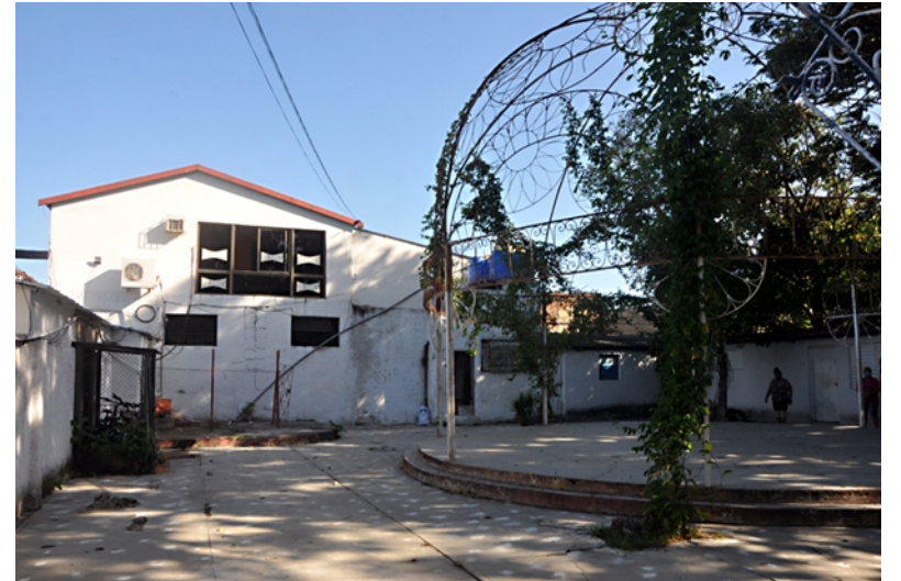
Centro cultural La Pérgola.