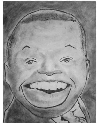
Bola de Nieve visto por Reyva.

Esta iniciativa se inserta dentro de las acciones que la Fundación desarrolla en el 2022 con motivo del aniversario 120 del natalicio